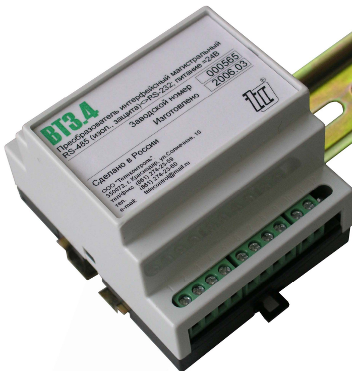
Рисунок 1 – Внешний вид преобразователя

2.3 Схема структурная преобразователя приведена на рисунке 2.